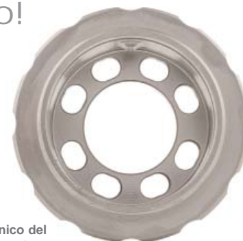
Trattamento galvanico del guscio per la schermatura

Nel connettore Syntax SGH, il guscio diventa parte integrante degli elementi di schermatura.